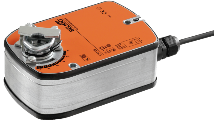
Resim üründen farklı olabilir